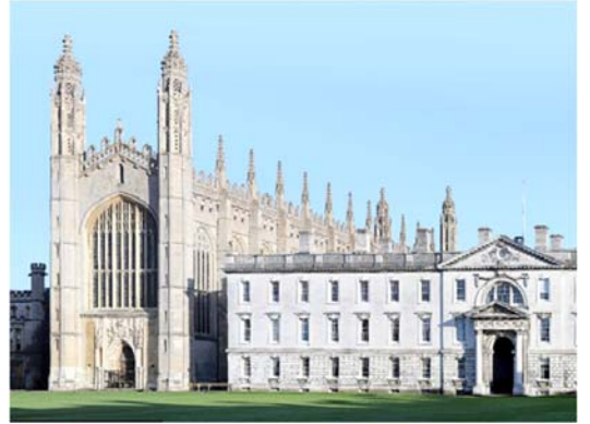
अॅलन टुरिंग रूमस

विद्या प्रसारक मंडळाच्यावतीने दरवर्षी भारतीय विद्यार्थी, शिक्षक आणि पालक यांच्यासाठी इंग्लंडची शैक्षणिक सहल आयोजित करण्यात येते. या सहलीत ऑक्सफर्ड, केंब्रिज आणि लंडन या तीन शहरांतील संग्रहालये, वाचनालये आणि शैक्षणिक संस्था यांना भेटी देण्यात येतात. केंब्रिज विद्यापीठ परिसरात पायी फेरफटका मारणे हा एक आनंददायी अनुभव असतो. त्यावेळी किंग्ज कॉलेज चॅपेलचे दर्शन घडविले जाते. त्याचबरोबर अॅलन टुरिंग रूमसचे देखील दर्शन घडविले जाते. अॅलन या कॉलेजचा विद्यार्थी होता. त्याचा सन्मान करण्यासाठी कॉलेजच्या एका विभागाला अॅलन टुरिंग रूमस असे नाव दिले आहे. या खोल्या दाखवून या महान शास्त्रज्ञाच्या कामाची माहिती सहलीत सहभागी झालेल्या सर्वांना दिली जाते.